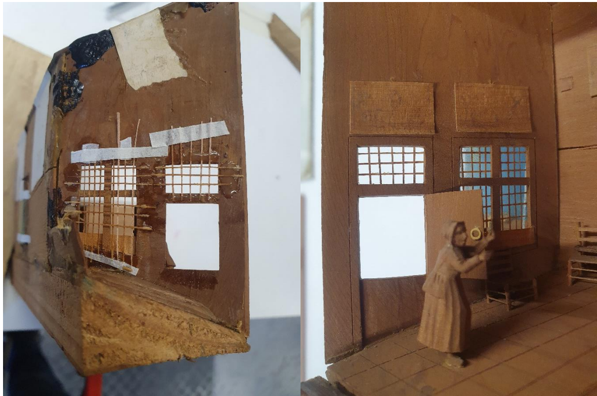
Foto 6 : linkerkant Bavelaar, na restauratie & Foto 7: binnenkant Bavelaar na restauratie